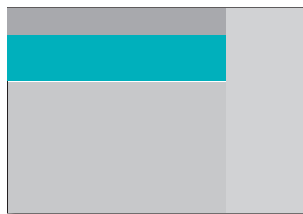
Billboard (970 x 250 px) € 2.550,-